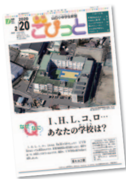
▷山梨日日新聞(月額3,400円税込) 小中学生新聞 毎週木曜日発行