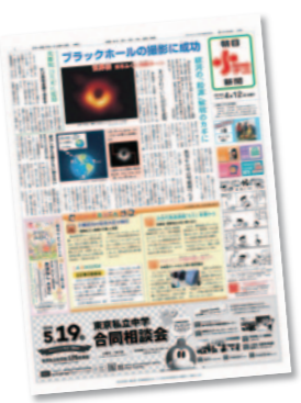
▷朝日小学生新聞 毎日発行(月額1,769円税込)