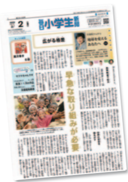
▷毎日小学生新聞 毎日発行(月額1,580円税込)