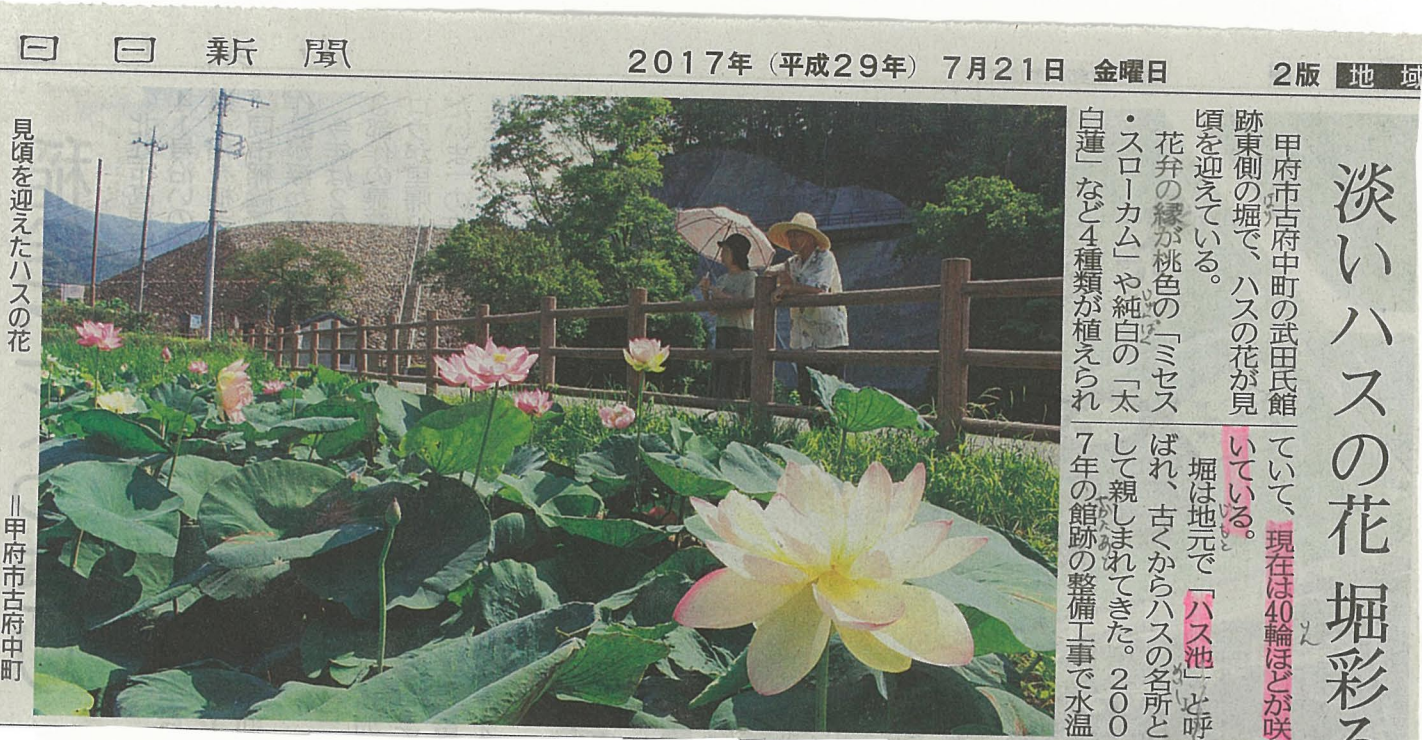
見頃を迎えたハスの花