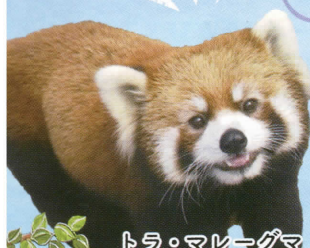
トラ・マレーグマ ライオン・レッサーパンダ