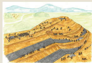
ぜんぽうこうえんふん つく ひどびと 前方後円墳を造る人々(イメージ)

かききかくてん やまなし こふん 夏季企画展「山梨にでっかい古墳ができたわけ。」