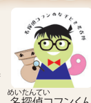
めいたんてい 名探偵コファンくん

ばしょ けんりつこうこはくふつかん 参加費/無料 所要時間/約30分 開催時間/10時～12時・13時～15時 定員/なし、参加賞は数量限定