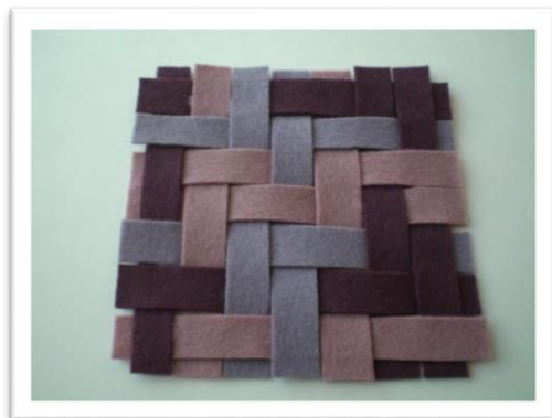
できあがりイメージ

会場 山梨県生涯学習推進センター 交流室 対象 小学生以上のお子様とその保護者 定員 親子10組 持ち物 筆記用具 受講料 なし 教材費 200円