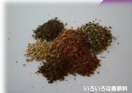
いろいろな香原料

会場 山梨県生涯学習推進センター 交流室 対象 どなたでも参加できます（小学生以下のお子様は保護者同伴） 定員 20名 持ち物 筆記用具 受講料 なし 教材費 800円